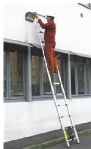
Scala aperta 3,80 m.